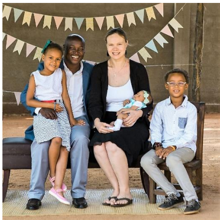
Kuva vas: London perhe

Tervehdys Tansaniasta! Menneenä kesänä Suomessa saikin nauttia kesällä lähes trooppisesta helteestä, ja ilma oli lämpimämpää kuin Tansaniassa kyseisenä aikana. Tansaniassa kesä-elokuu on vuoden kylminä aikaa, yölämpötilat voivat Morogorossa olla lähellä +15 astetta, joka tuntuu todella kylmältä, ja päivälläkin alle +30 astetta. Ylhäällä vuorilla on vielä kylmempää. Nyt kuitenkin ollaan kuumempaan päin menossa vuoden loppua kohti.