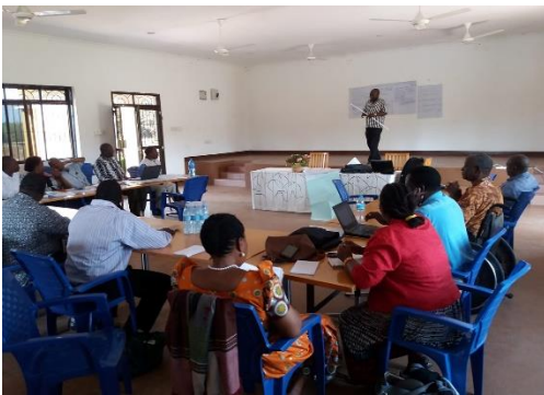
Kuva vas. Hiippakunnan suunnittelukokous.