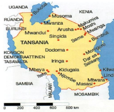
Kuva oik: Tansanian kartta