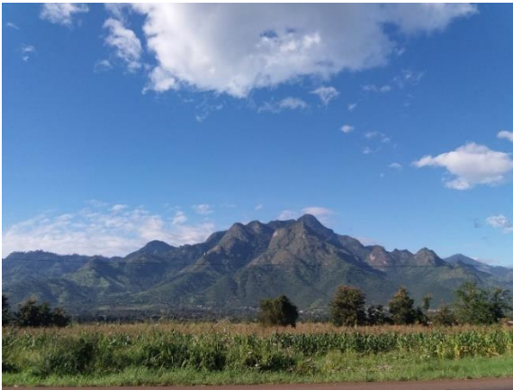
Kuva vas: Morogoron maisemia

Morogoron kaupunki on noin 300 000 asukkaan keskikokoinen kaupunki Tansanian keskiosissa. Se on ensimmäinen suuri kaupunki lähettäessä länteen sisämaahan päin rannikon suurimmasta kaupungista Dar es Salaamista. Morogoron ympäröi Uluguru-vuoret, jotka luovat jylhän kauniin silhuetin kaupungin taustalle.